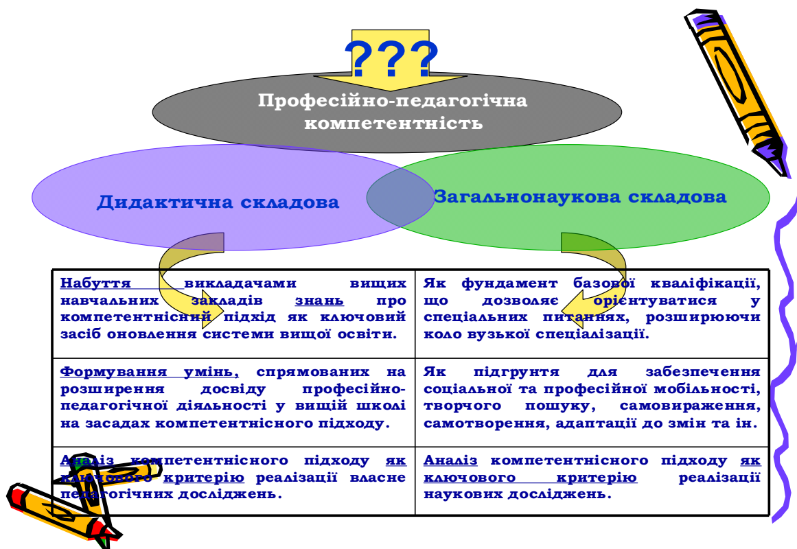
Рис. 2. Дидактична та загальнонаукова складові професійно-педагогічної компетентності викладача вищого навчального закладу

Проектне завдання виноситься на захист (бюджет часу для захисту – 10 хвилин) та реалізується з використанням аудіовізуальної підтримки (таблиці, схеми, презентації тощо).