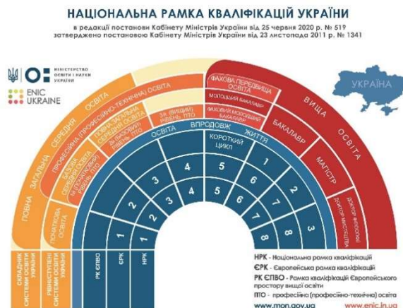
Fig. 1. National Qualifications Framework of Ukraine

The following components are considered during the research: access to preschool education (preschool education services are physically and economically accessible to all families and their children; preschool education facilities are participatory, inclusive, and accepting of diversity); educators (highly qualified staff who initiate their own continuous learning and retraining to fulfill their professional roles; supportive working conditions, including professional leadership, that create opportunities for observation, reflection, planning, teamwork, and collaboration with parents) that use the approaches that allow children to realize their full potential. Thus, the educational component is based on pedagogical goals, values, and through a holistic approach; a curriculum that requires teaching staff to collaborate with children, colleagues, and parents, and to reflect on their own work.